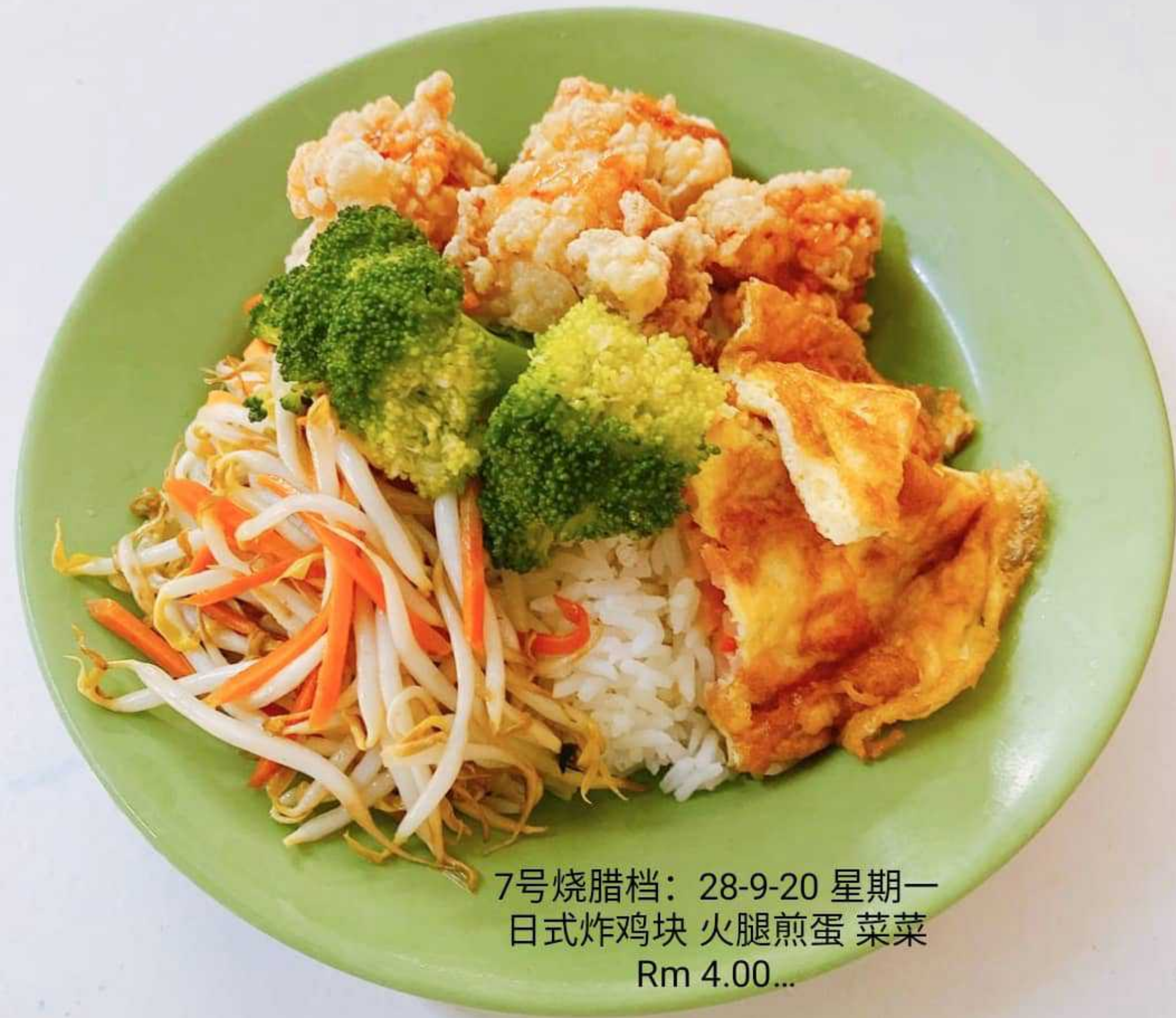
7号烧腊档：28-9-20 星期一 日式炸鸡块 火腿煎蛋 菜菜 Rm 4.00...